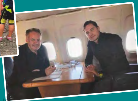
Prijali sme pozvanie prezidenta SR Andreja Kisku na pracovnú cestu do Kene (február 2017)