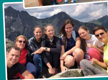
Sme skvelý tím aj mimo práce